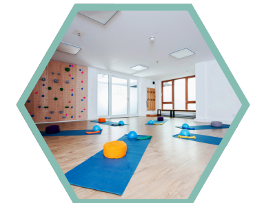
großzügig ausgestatteter Kursraum