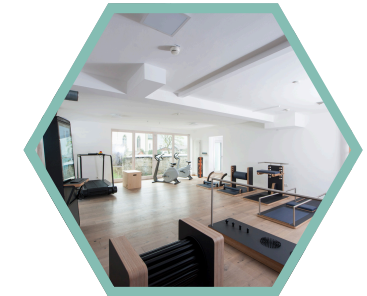
Five Rücken-, Faszien- & Gelenkstudio