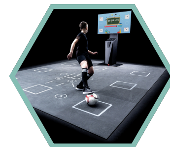
vikomotorisches Training im Skillcourt