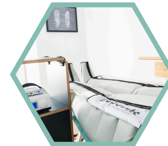
moderne Räumlichkeiten & zahlreiche passive Maßnahmen